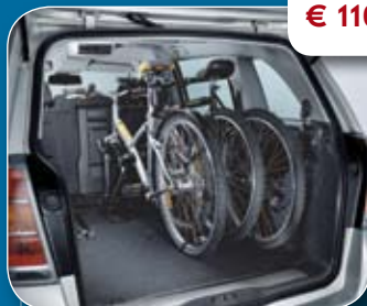
● Interne fiestdrager