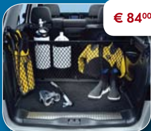
● FlexOrganizer: Flexibele scheidingswand