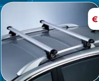
● Aluminium allesdrager