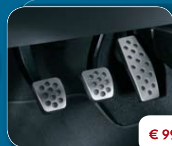
● OPC Line RVS pedalen