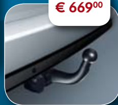
● Afneembare trekhaak