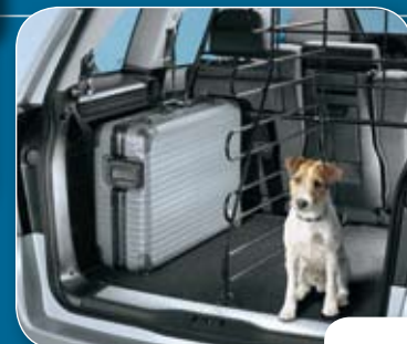
● Hondenscheren en scheidingsrooster