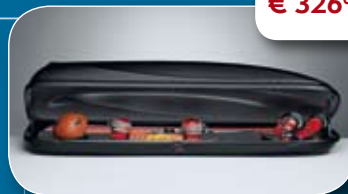
● Dakkoffer L Sport 700